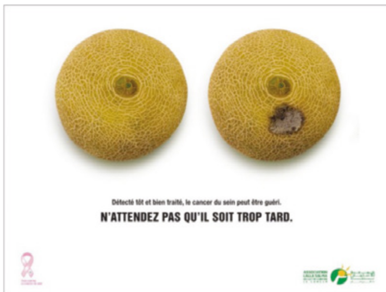
▲ Visualisatie borstkanker PowerPoint Naziha Maher, VLK

In het kader van 'Meer dan 100 soorten kanker' heeft Naima El Koudri van SIGIN gebruikt gemaakt van visuele aspecten, maar deze daarnaast ook tastbaar gemaakt voor de vrouwen waar zij voorlichting aan gaf. Zo heeft zij met behulp van een klein bolletje aluminium met een spons in een bh voelbaar gemaakt hoe een knobbeltje in de borst voelt en hoe klein dit is. De vrouwen konden zelf komen voelen en vragen stellen.