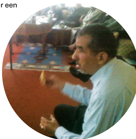
► Voorlichting 'Meer dan 100 soorten kanker', SIGN 2013. SIGIN, www.interculturele zorg.com

"De doelgroep is meestal gelovig en het heeft meerwaarde om ziekte, genezing en misschien ook dood via religie bespreekbaar te maken. De algehele opvatting onder Turkse gelovigen is wel dat er alleen voor de dood geen middel is en dat voor het overige de wonderen de wereld niet uit zijn en zij moeten blijven geloven en hopen." (K. Bölek, Het Inter-lokaal, 2014).