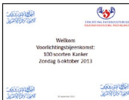
◀ Sheet uit de Power Point voorlichting 'Meer dan 100 soorten kanker' van SIGN

Stichting Voorlichters Gezondheid heeft bij deze groep wel goede ingangen en vandaar dat zij besloten hebben om deze groep te betrekken binnen dit project. Tijdens de projecttijd zijn 456 vrouwen bereikt. Deze zijn bijeengekomen in 23 verschillende bijeenkomsten.” (F. el Bouazzaoui, Stichting Voorlichters Gezondheid, 2014).