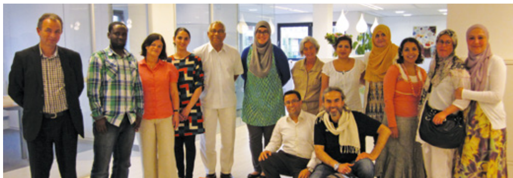
▲ Voorlichters van 'Meer dan 100 soorten kanker', 2013

De volgende deelnemers hebben deelgenomen aan deze training: 12 migranten voorlichters, 4 vertegenwoordigers van migrantenorganisaties, 3 medewerkers van Pharos, 2 vertegenwoordigers van Lymfklier Vereniging, 2 vertegenwoordigers van Mammamosa* en een vertegenwoordiger van Stoma Vereniging. Van de trainingen is een verslag gemaakt.